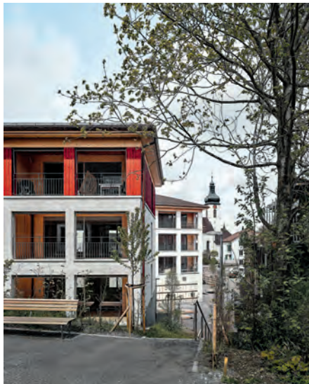
Situationen zwischen Dorf und Landschaft