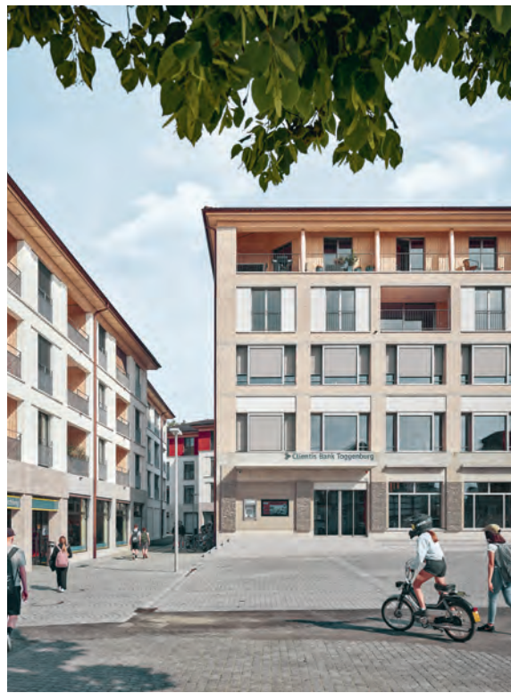
Der neue Dorfplatz in Kirchberg SG mit dem Bankgebäude der Bauherrin.