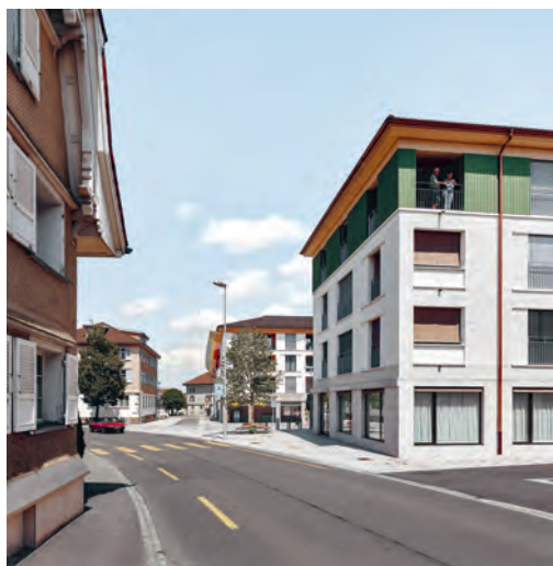
Entlang der Hauptstrasse sind neue Bauten entstanden.