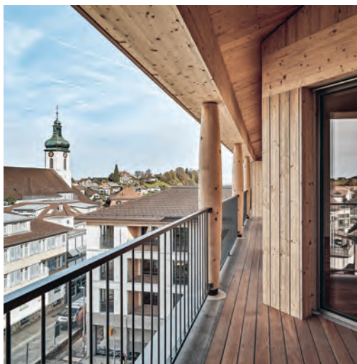
Die obersten Geschosse sind mit Holz verkleidet.