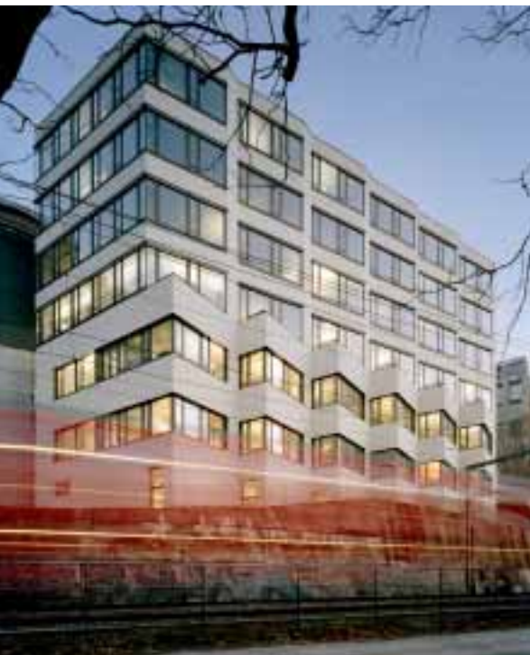
Bürogebäude DL 4, Liftturm mit Brücke, Malzturm in der Gasse des Fabrikareals