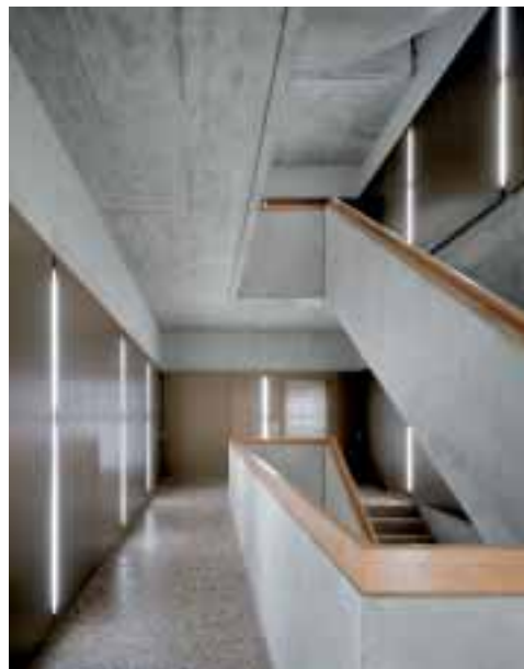
Treppenanlage im Wohnhaus